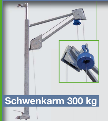
Schwenkarm 300 kg