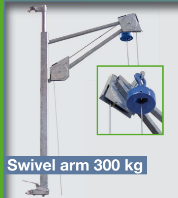
Swivel arm 300 kg